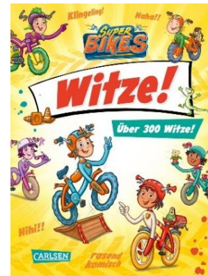
SUPERBIKES Witze! 144 Seiten ISBN 978-3-551-27188-4 Erscheinungstermin: 26.03.2026