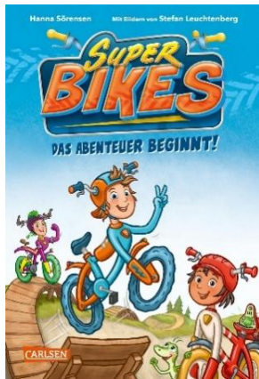
SUPERBIKES Das Abenteuer beginnt! 144 Seiten ISBN 978-3-551-27187-7 Erscheinungstermin: 26.03.2026