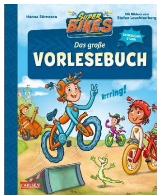
SUPERBIKES Das große Vorlesebuch 128 Seiten ISBN 978-3-551-27184-6 Erscheinungstermin: 26.03.2026