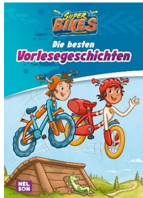
SUPERBIKES Die besten Vorlesegeschichten 80 Seiten ISBN 978-3-8451-2971-6 Erscheinungstermin: 26.03.2026