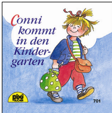
Der Anfang einer Erfolgsgeschichte: Das erste Conni-Buch erschien 1992 im Pixi-Format.